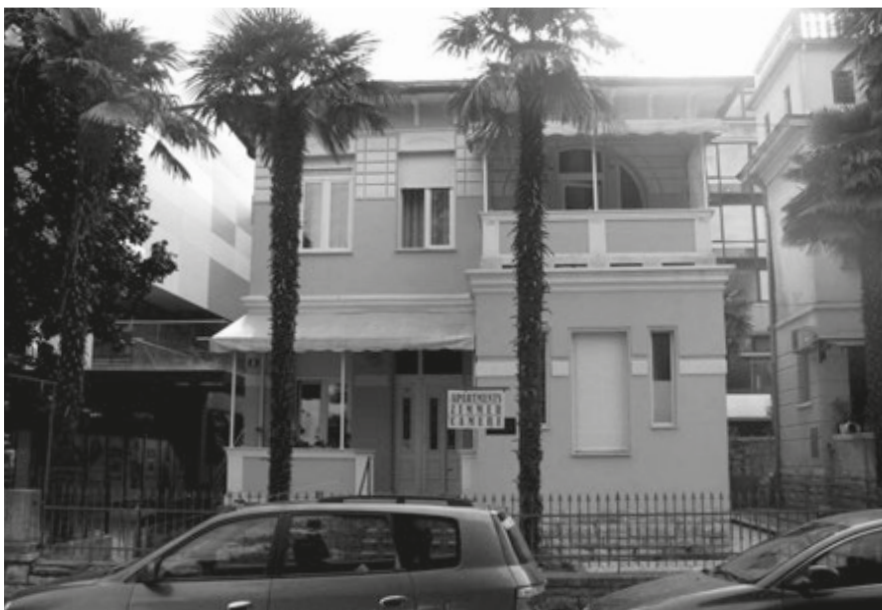
Sl. 2. Rodna kuća braće Visintini u Poreču, u današnjoj Ulici Rade Končara (snimio: Bojan Horvat, 26. travnja 2014.).